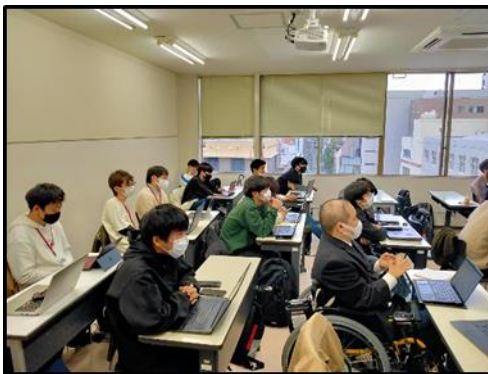
麻生情報ビジネス専門学校福岡校会場

今後も当社は産学連携プロジェクトを継続的に実施し、学生たちに実践的なモノ作りの場を提供することで、社会に貢献できる技術者の育成支援を行って参ります。